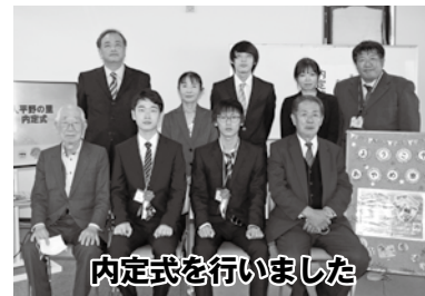
内定式を行いました