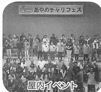
～あやめ寮のみんなで歌と踊りを披露～

11月18日(日)、第10回あやめチャリフェスタが、開寮30周年の節目を迎えての開催となりました!今年度はW・A・G様の盛大なライブパフォーマンスからスタートしました!!屋内のステージ発表とともに屋外の模擬店出店と、多数の他団体にご尽力いただきまして、ありがとうございました。また、ご来場の皆様、関係者の皆様には心から感謝申し上げます。