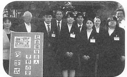
内定式 ～来年度からお願い致します！～