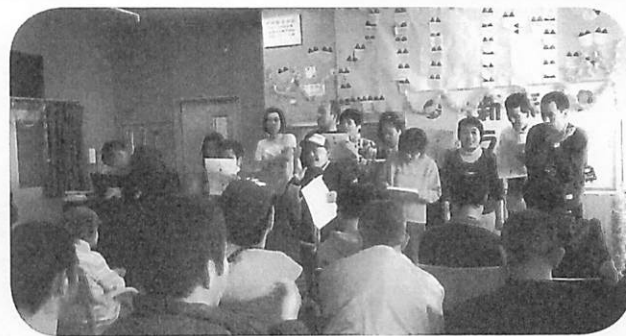
新年会 ～新春カラオケ大会～