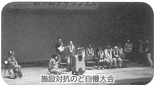
～すばらしい歌をありがとう～