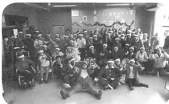
～あやめ寮にもサンタさん来たよ!～