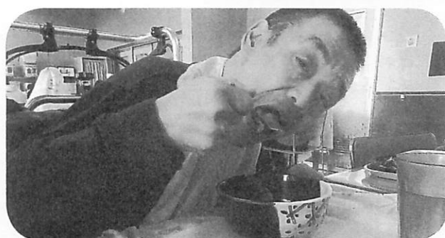
おせち ～あけましておめでとう～