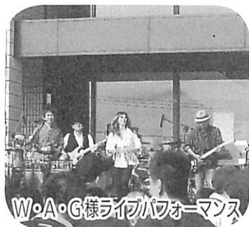
～歌って踊りました～

11月18日(日)、第10回あやめチャリフェスタが、開寮30周年の節目を迎えての開催となりました!今年度はW・A・G様の盛大なライブパフォーマンスからスタートしました!!屋内のステージ発表とともに屋外の模擬店出店と、多数の他団体にご尽力いただきまして、ありがとうございました。また、ご来場の皆様、関係者の皆様には心から感謝申し上げます。