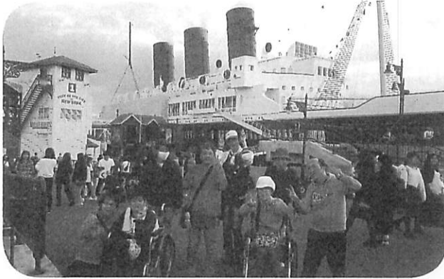
希望旅行ディズニーシー ～夢の国、楽しんでできました！～