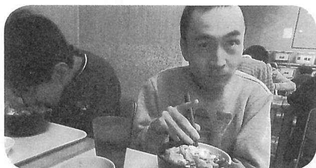
年越しそば ～締め一杯美味しい～